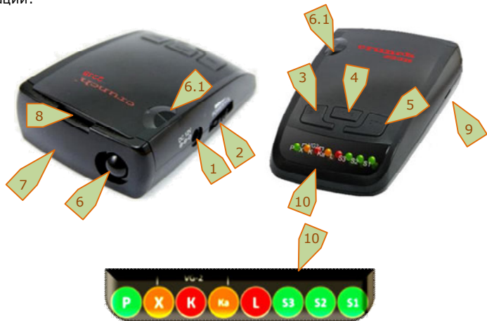
223Black -5- 223Black CRUNCH

На рисунке показан внешний вид прибора, органы управления и индикации: